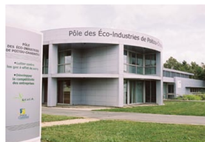
Poitiers est fort de son Université et de ses industries de pointe