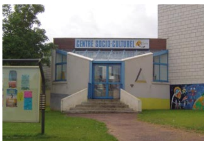
Développer les équipements socio-culturels