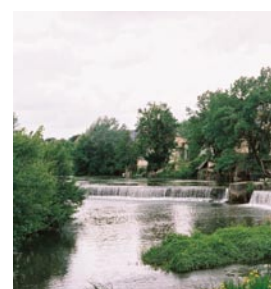
Défendre l'environnement et le cadre de vie