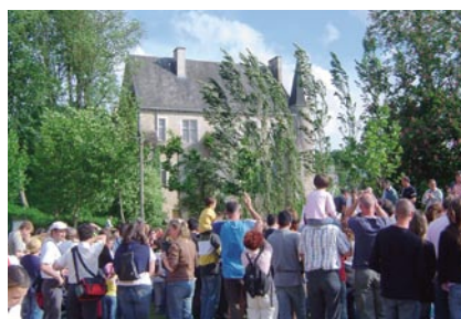
Valoriser le patrimoine et les sites touristiques