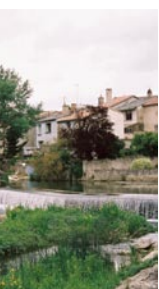
Environnement de vie