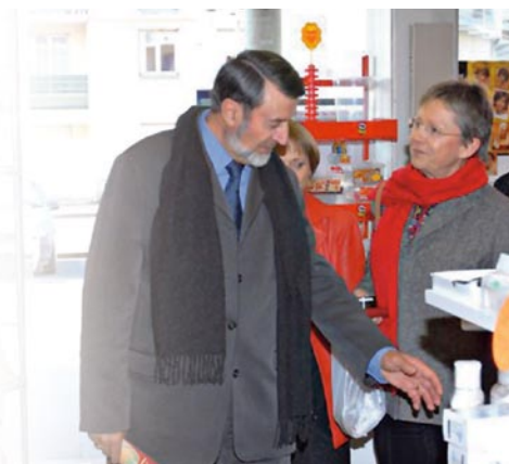
Défendre le commerce de proximité