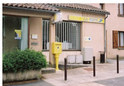
Maintenir et moderniser les services publics